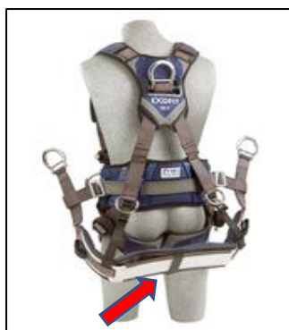
Типичное поддерживающее сидение указано красной стрелкой

Компания 3M Fall Protection получила сообщения о том, что алюминиевые усиливающие пластины, которые используются в поддерживающих сидениях отдельных страховочных привязей DBI-SALA ExoFit™, ExoFit XP™ (также с защитой от дугового разряда) и ExoFit NEX™ (также с защитой от дугового разряда) могут перемещаться со своего места в ляшках. В нескольких случаях алюминиевая пластина для сидения выпадала из страховочной привязи и падала на землю, создавая потенциальную угрозу для получения травмы от падающего предмета. Сообщения о травмах или несчастных случаях, связанных с этой проблемой, не поступали. Указанная проблема не отразилась на рабочих характеристиках страховочных привязей. Они будут работать надлежащим образом с сохранением всех параметров, в том числе в случае их использования для фиксации тела в индивидуальных страховочных системах при падении, даже без того дополнительного комфорта, который обеспечивает поддерживающее сидение.